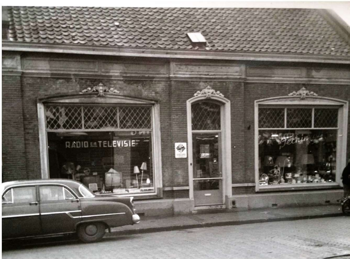
Het pand nadat de winkel vergroot werd, en ook het linker gedeelte erbij werd getrokken. Foto omstreeks de jaren 1960. (HdG)

Kaatsheuvel, maar speciaal de Hoofdstraat, is weer een winkelpand rijker geworden, dat als een sieraad kan worden beschouwd en dat qua inrichting en inhoud kan concurreren met iedere stadszaak”.