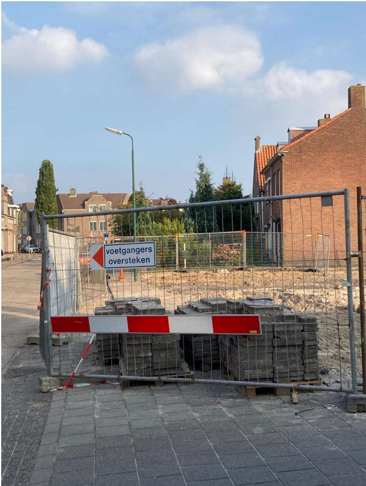
Op de plek Hoofdstraat/hoek Dr. Van Beurdenstraat (achter de hekken) van waaruit destijds de radiodistributie in Kaatsheuvel werd geregeld, en daarna ooit elektrotechnisch bureau "Techinka" was gevestigd, zal anno 2022 een appartementencomplex verrijzen...(HdG)